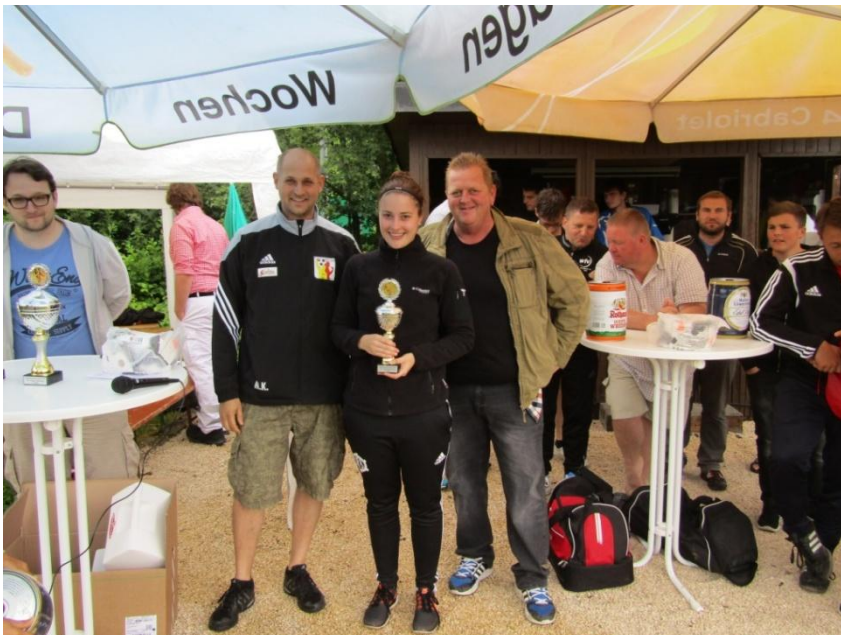
Die dritten Sieger von der Gruppe Stuttgart