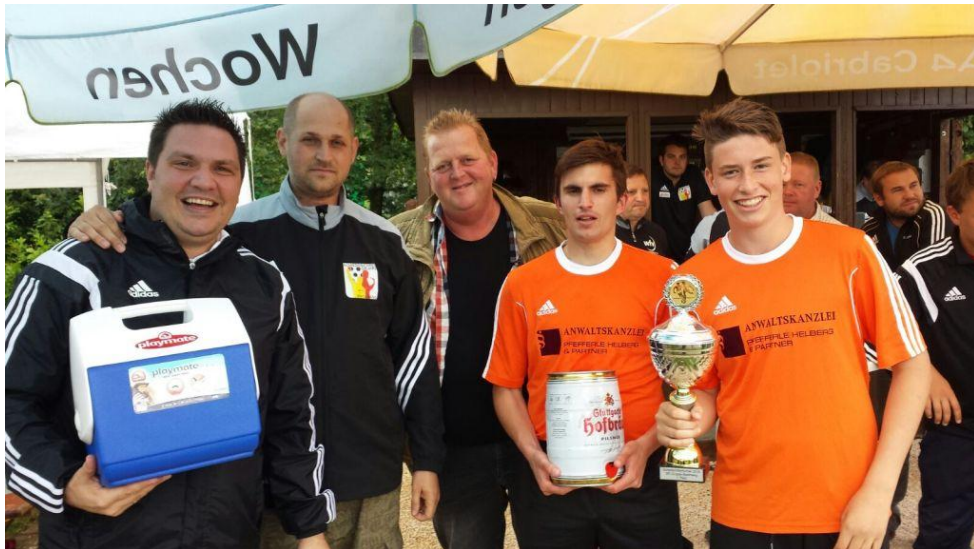
Die strahlenden Sieger von der Gruppe Kocher/Jagst