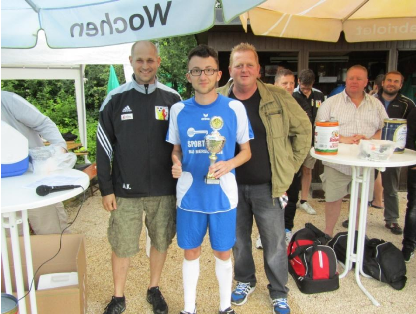
Die zweiten Sieger von der Gruppe Bad Mergentheim