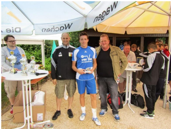
Der erfolgreichste Torschütze kommt aus Bad Mergentheim (m.)